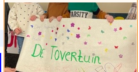
Onze peutergroep heet nu: De Tovertuin!